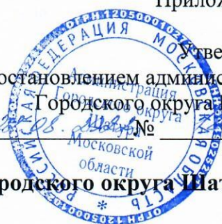
Схема перекрытия движения при праздновании Дня Городского округа Шатура

утверждена постановлением администрации Городского округа Шатура от 28.04.2016 № 14/02/16-100/2016